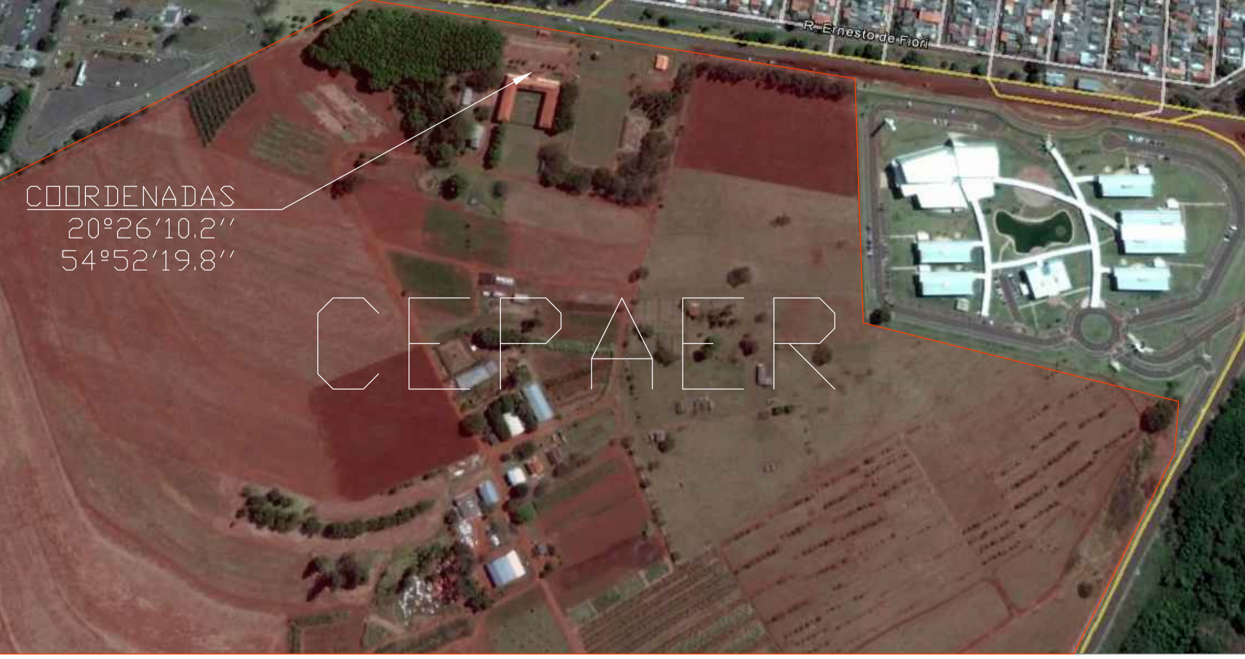
PLANTA LOCALIZAÇÃO ESC: 1/5000